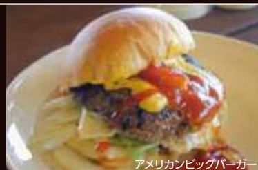
アメリカンビッグバーガー