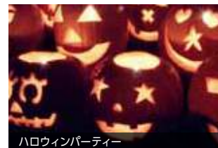
ハロウィンパーティー