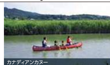
カナディアンカヌー