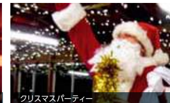
クリスマスパーティー