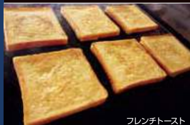
フレンチトースト