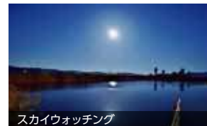
スカイウォッチング