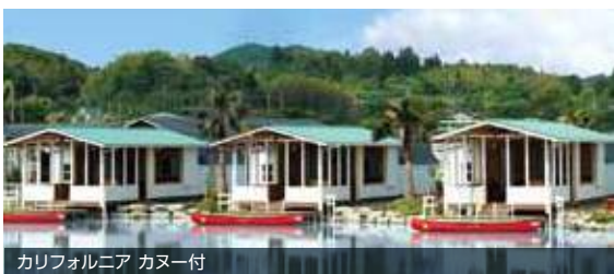
カリフォルニア カヌー付