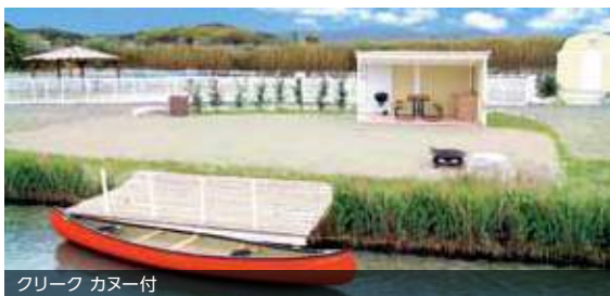
クリーク カヌー付